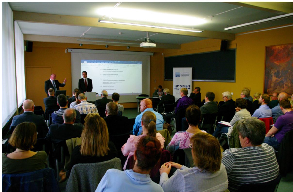
Landesgewerkschaftstag des BTB Sachsen-Anhalt am 28.09.2018

Der BTB Sachsen-Anhalt hat am 28.09.2018 seinen Landesgewerkschaftstag 2018 abgehalten und einen neuen Vorstand gewählt.